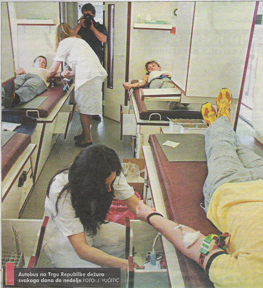
Autobus na Trgu Republike dežura svakoga dana do nedelje